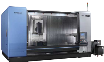
VCF 850 LSR Centros de Usinagem Verticais