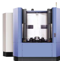
NHM 6300 Centros de Usinagem Horizontais