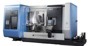
Puma SMX3100 Máquinas Multitarefa