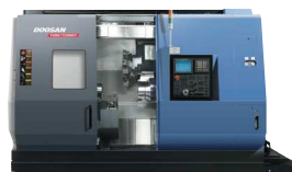
Puma TT2500 Centros de Torneamento